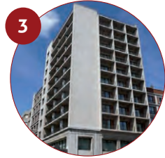
3 Hotel Conde Luna 4* Avenida Independencia, 7 24003 León