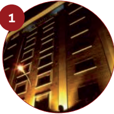
1 Hotel Quindós 3* Gran Vía San Marcos, 38 24002 León