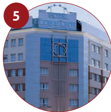
5 Hotel Silken Luis de León 4* C/ de Fray Luis de León, 26 24005 León