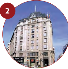
2 Hotel Sercotel Alfonso V 4* Avenida Padre Isla, 1 24002 León