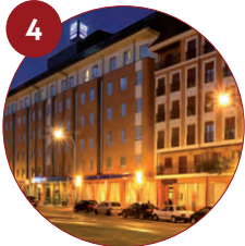
4 Hotel Tryp León 4* Obispo Vilaplana, 3-5 24008 León