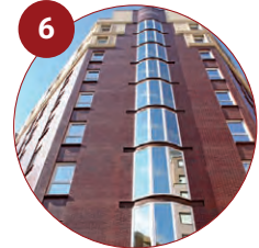
6 Eurostars León 4* Velázquez, 18 24005 León